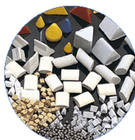
MultiFinish feine Verfahrensmittel

Gewerbestrasse 13 75328 Schömberg-Langenbrand Germany Tel: +49 7084 927330 Fax: +49 7084 9273333 Email: infol@multifinish.de Web: www.multifinish.de