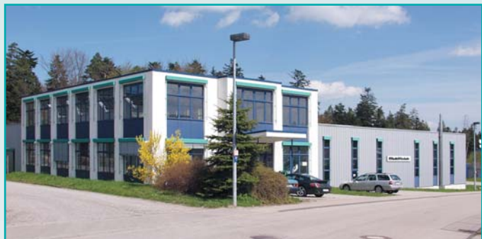
MultiFinish – Fabrikationshalle und Bürogebäude in Schömberg-Langenbrand bei Pforzheim (Deutschland)

Gemeinsam mit Ihnen realisieren wir Anforderungen unter anderem für die Metall-, Kunststoff- und Textilindustrie, für die Medizintechnik wie auch für die Schmuck- und Uhrenbranche. Unsere Erfahrung und unser Wissen rund um das Themengebiet der „Gleitschleiftechnologie“ sowie das Engagement unserer Mitarbeiter in Verbindung mit unserem umfassenden Maschinen-, Produkt- und Dienstleistungsprogramm garantieren Ihnen optimale Lösungen für Ihre Oberflächenveredelungen.